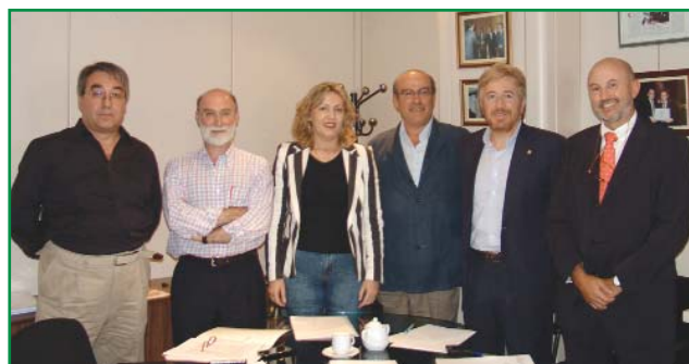
Algunos representantes de las organizaciones

En la última reunión celebrada entre las organizaciones que suscriben el Decálogo de Medidas Urgentes para Ap también se efectuó una revisión de las contestaciones recibidas por parte de las Comunidades Autónomas