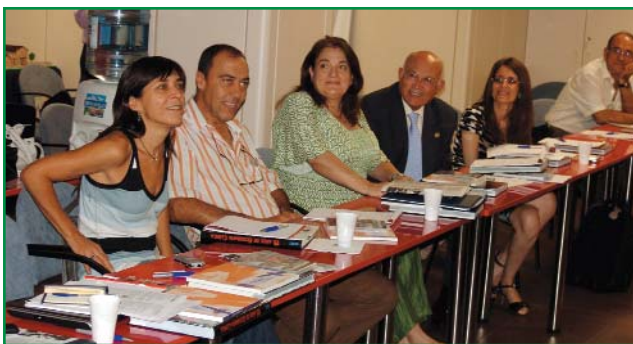
Algunos representantes autonómicos

Entre los puntos clave abordados en la reunión destacó la inclinación e interés de la SEMG por la