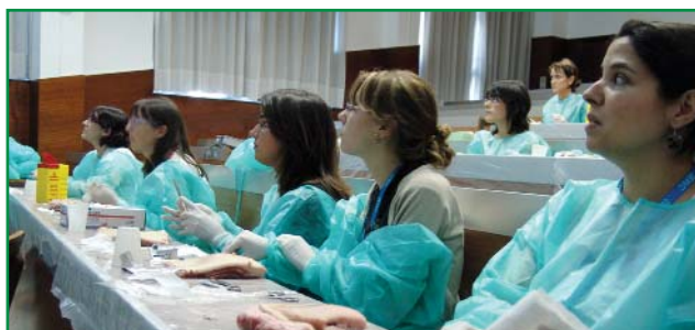
Muchos estudiantes han vuelto a disfrutar con el Campus

coordinador de los tutores del curso online , quiso destacar en primer lugar el alto interés participativo de los médicos de referencia así como el hecho de que la gripe A “es una pandemia moderada a la que se le ha dado demasiada difusión en los medios de comunicación” y que también existen puntos positivos ya que “tiene como valor añadido la educación en medidas de higiene y salud pública de la población y la mejora y puesta a punto de la organización del Sistema Sanitario”.