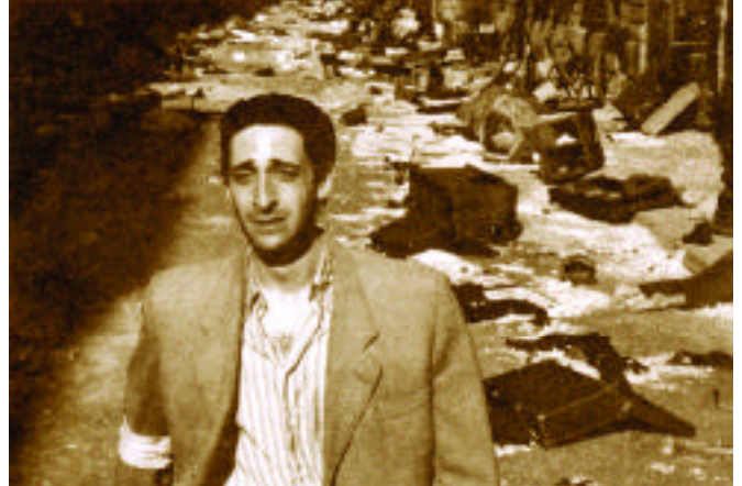
Polanski vuelve a demostrar su natural genialidad en El Pianista

Cuando se habla de Roman Polanski se dice que es un director de cine que siempre ha estado obsesionado por lo tenebroso y todo lo que comporta una actitud marginal (recordemos películas como El cuchillo bajo el agua , Repulsión , La semilla del diablo , El inquilino , La muerte y la doncella , o Tess ), aunque siempre ha realizado filmes inteligentes y de una factura técnica inmejorable. Sabemos que su vida personal se vio afectada cuando la violenta familia Manson irrumpió en su casa y asesinó a su esposa la actriz Sharon Tate. Ahora que ha realizado esta excelente película con la maestría de los directores que dominan totalmente el lenguaje cinematográfico ( El Pianista ), nos enteramos de que nada de lo que sucediera en sus antiguos filmes era comparable al horror de lo vivido en su niñez. "Siempre supe que haría algo sobre este doloroso período de la historia polaca, pero no quería que fuera autobiográfico", dice en una entrevista reciente. Y no sabemos si este distanciamiento que propone es posible en alguien cuya madre fue gaseada en un campo de exterminio y su familia diezmada por el holocausto. El filme conmociona al espectador por la crudeza de las imágenes y el lirismo con que encara la sensibilidad humana de todos los personajes, plasmando tan sutilmente que en cualquier lugar que se sitúen hay buenos y malos. Probablemente esta película nos descubra el porqué de tanta obsesión por indagar sobre el mal. Es que des-