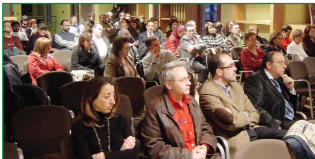
Un momento de lo Encontros Galegos da Medicina Xeral .

“Estamos en un momento caracterizado por la existencia de un descontento importante dentro de la profesión,