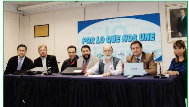
La sede de la SEMG acogió el comité de huelga el día 10.

También durante el mismo 10 de abril, la SEMG expresaba su agradecimiento a los pacientes por su comprensión y por el apoyo recibido en una causa con intereses comunes, no sólo durante las jornadas de huelga, sino también durante el largo proceso de preparación de estas movilizaciones y durante las fases de negociación con la administración. Porque, como se explica desde la propia Sociedad, éste es un proyecto común que beneficiará a toda la ciudadanía, y así lo comparten los pacientes, a pesar de las molestias que estos paros les puedan ocasionar.