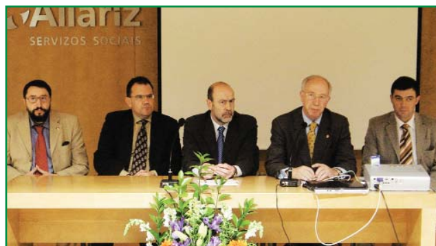
El encuentro giró en torno a la actual situación de la AP.