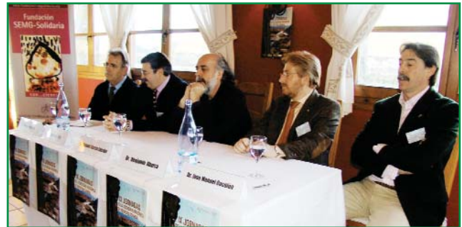
Mesa de debate sobre el futuro de la atención primaria.