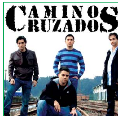
Portada del primer CD del grupo Caminos Cruzados.

Para adquirir este CD, cuyo precio es de 10 euros (incluidos gastos de envío), tienes que enviar un e-mail con tu nombre y dirección postal al siguiente correo: presidentepatronato@fundacionsemgsolidaria.org