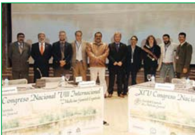
Los presidentes de las sociedades de Nicaragua, Bolivia, México y República Dominicana y España

En cuanto a la SONIMEG, cabe recordar que ya cuenta con más de 700 afiliados y que participa activamente en los ámbitos de salud más urgentes en el país, sobre todo en la lucha contra la mortalidad materna y la despenalización del aborto.